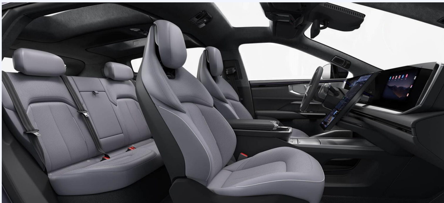
Серый из кожи Наппа, бархатная крыша из микрофибры