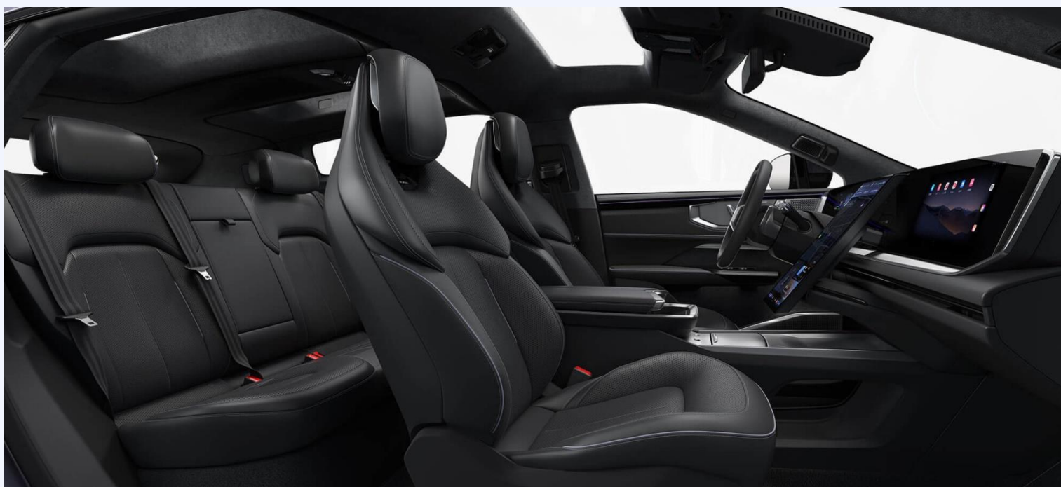
Чёрный из кожи Наппа, бархатная крыша из микрофибры