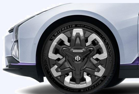
R22 Flexible Armor Wheels