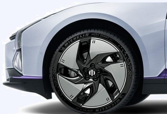
R22 Vector Shield