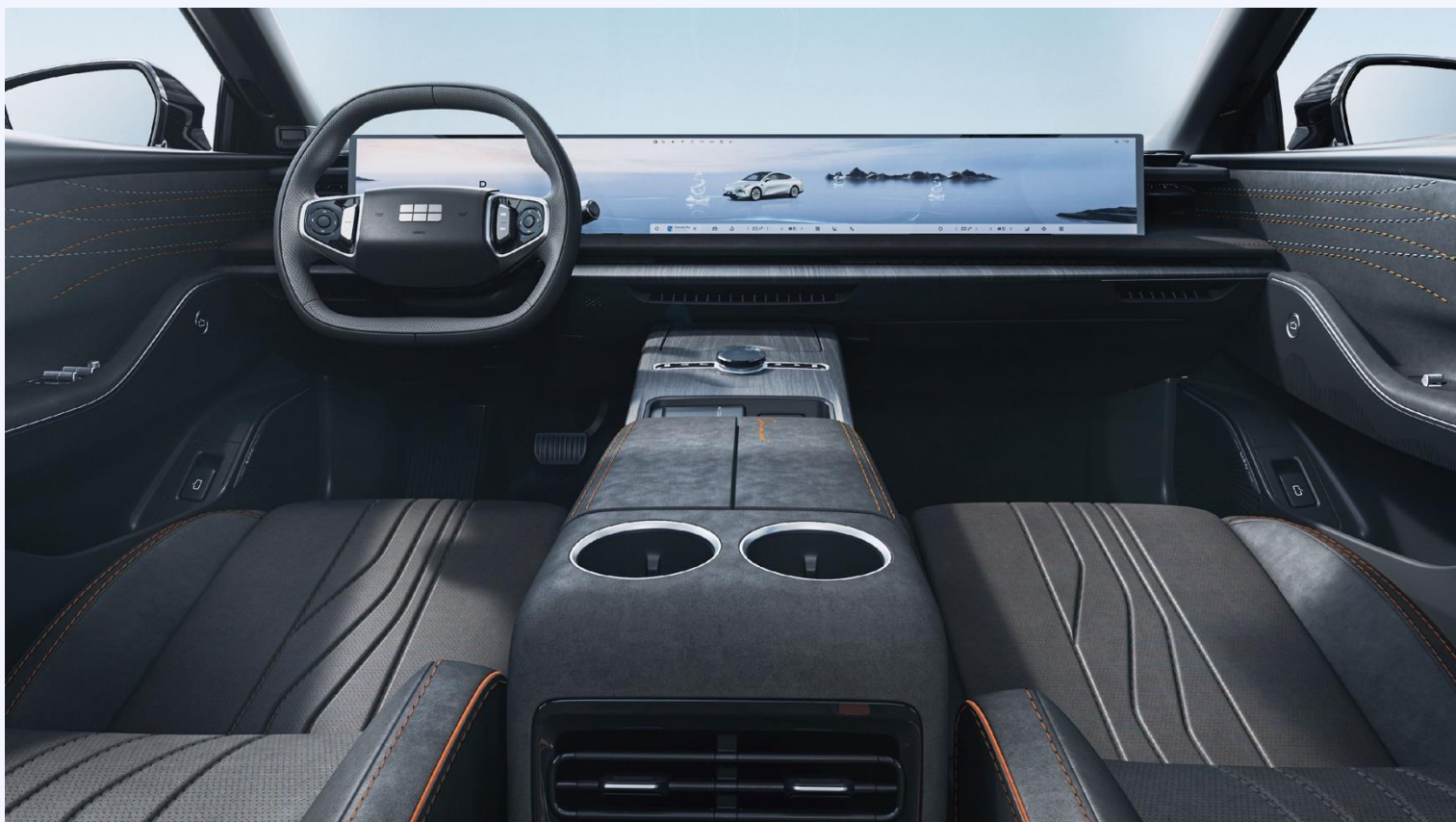
Серый с оранжевыми вставками